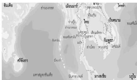
แผนที่แสดง ความทอดยาวติดต่อระหว่างอ่าวเบงกอลกับอ่าวเกาะตะมาหรือ อ่าวมะตะบัน (Mataban)

รัชสมัยพ่อขุนรามคำแหงมหาราชแห่งอาณาจักรสุโขทัย (ครองราชย์ พ.ศ. 1820-1841) เมืองมะริดและเมืองตะนาวศรีเป็นเมืองในกลุ่มอาณาจักรมอญ ซึ่งในสมัยพระเจ้าฟ้ารั่ว (มะกะโท) แห่งอาณาจักรมอญนั้น ได้มีความสัมพันธ์อันดีกับอาณาจักรสุโขทัยเพราะระบบเครือข่ายที่สร้างขึ้น (ฮอลล์, 2549: 170) โดยพระเจ้าฟ้ารั่วมีฐานะเป็นลูกเขยของพ่อขุนรามคำแหงมหาราช ความสัมพันธ์ดังกล่าวทำให้อาณาจักรสุโขทัยมีอิทธิพลเหนือหัวเมืองมอญแถบเกาะตะมา (หม่องทินอ่อง, 2549: 49-50) รวมถึงเมืองมะริดและตะนาวศรี