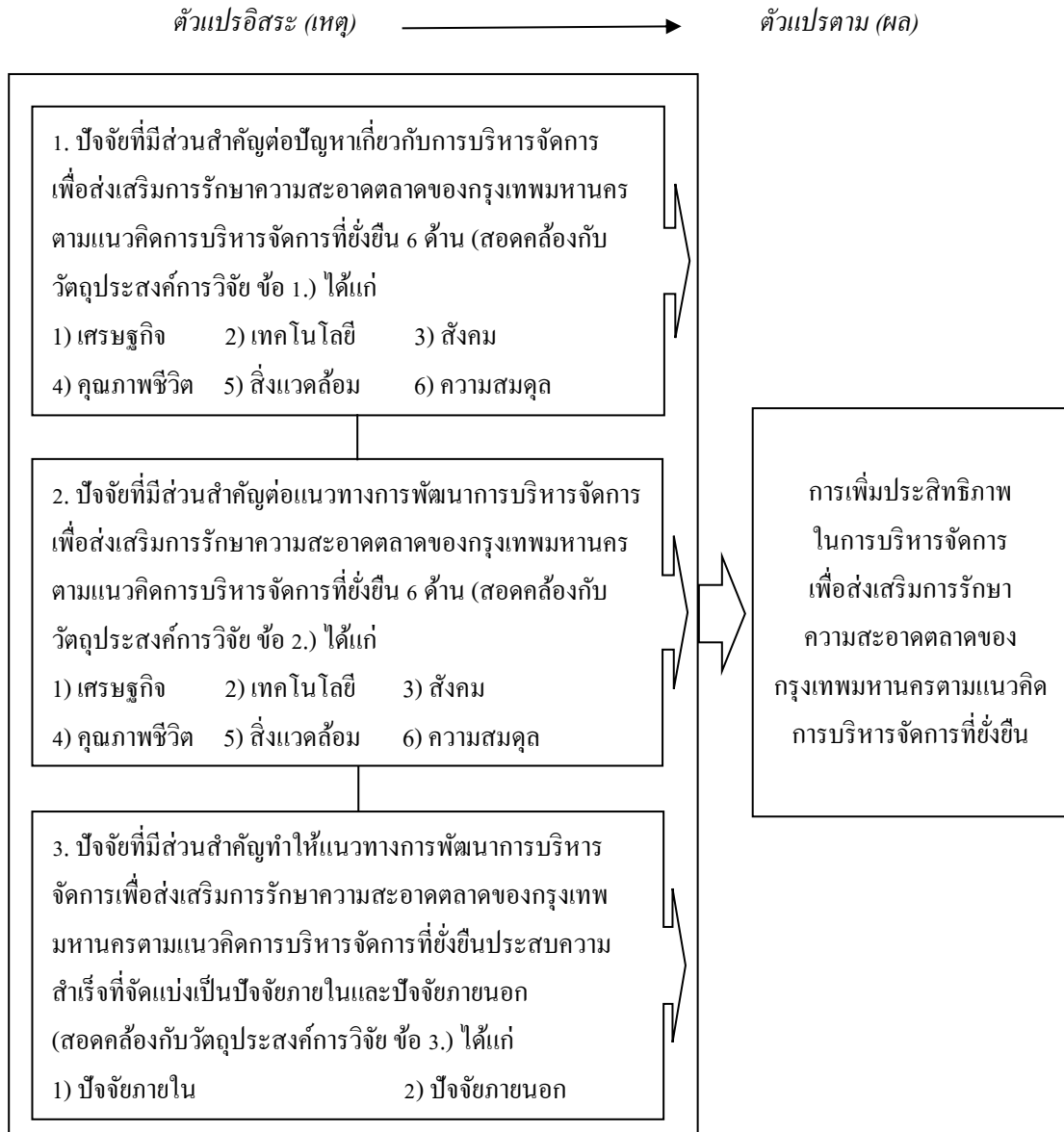
ภาพที่ 1 กรอบแนวคิดการวิจัยที่แสดงความสัมพันธ์ระหว่างตัวแปรอิสระกับตัวแปรตาม สำหรับการวิจัยเชิงปริมาณที่จัดแบ่งตามวัตถุประสงค์การวิจัย 3 ข้อ ของการศึกษารั้งนี้

การกำหนดกรอบแนวคิดการวิจัยส่วนที่เป็นตัวแปรอิสระ (เหตุ) และตัวแปรตาม (ผล) ตามวัตถุประสงค์การวิจัย 3 ข้อ ในลักษณะที่มีความสัมพันธ์อย่างเป็นเหตุเป็นผลต่อกันข้างต้น อธิบายได้ว่า ในส่วนของตัวแปรอิสระซึ่งประกอบด้วย 3 ตัวแปรช้อยนั้น เมื่อผู้ศึกษาได้ข้อมูลเกี่ยวกับปัญหา (หรืออีกนัยหนึ่งคือ สาเหตุ) แนวทางการพัฒนาการบริหารจัดการ และปัจจัยที่มีส่วนสำคัญที่ทำให้แนวทางการพัฒนาการบริหารจัดการประสบผลสำเร็จ ซึ่งทุกส่วนเป็นข้อมูลความคิดเห็นของกลุ่มตัวอย่างแล้ว ผู้ศึกษาได้นำข้อมูลดังกล่าวไปประมวล แปลผล และวิเคราะห์ เพื่อจัดทำเป็น