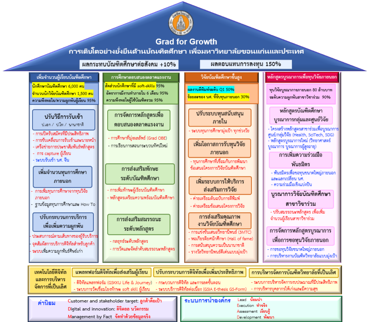
แผนภาพที่ 1 ยุทธศาสตร์การบริหารบัณฑิตวิทยาลัย